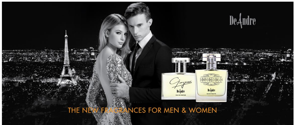
Bộ sưu tập nước hoa Deandre