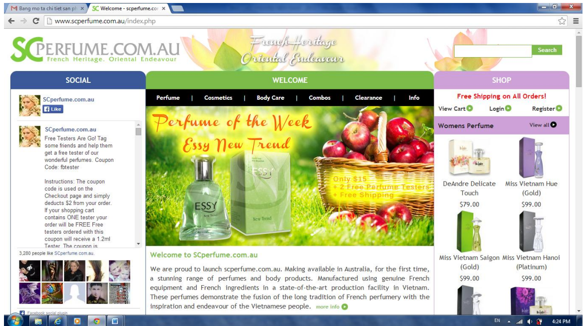
Hình ảnh các sản phẩm trên trang web bán hàng online tại Úc